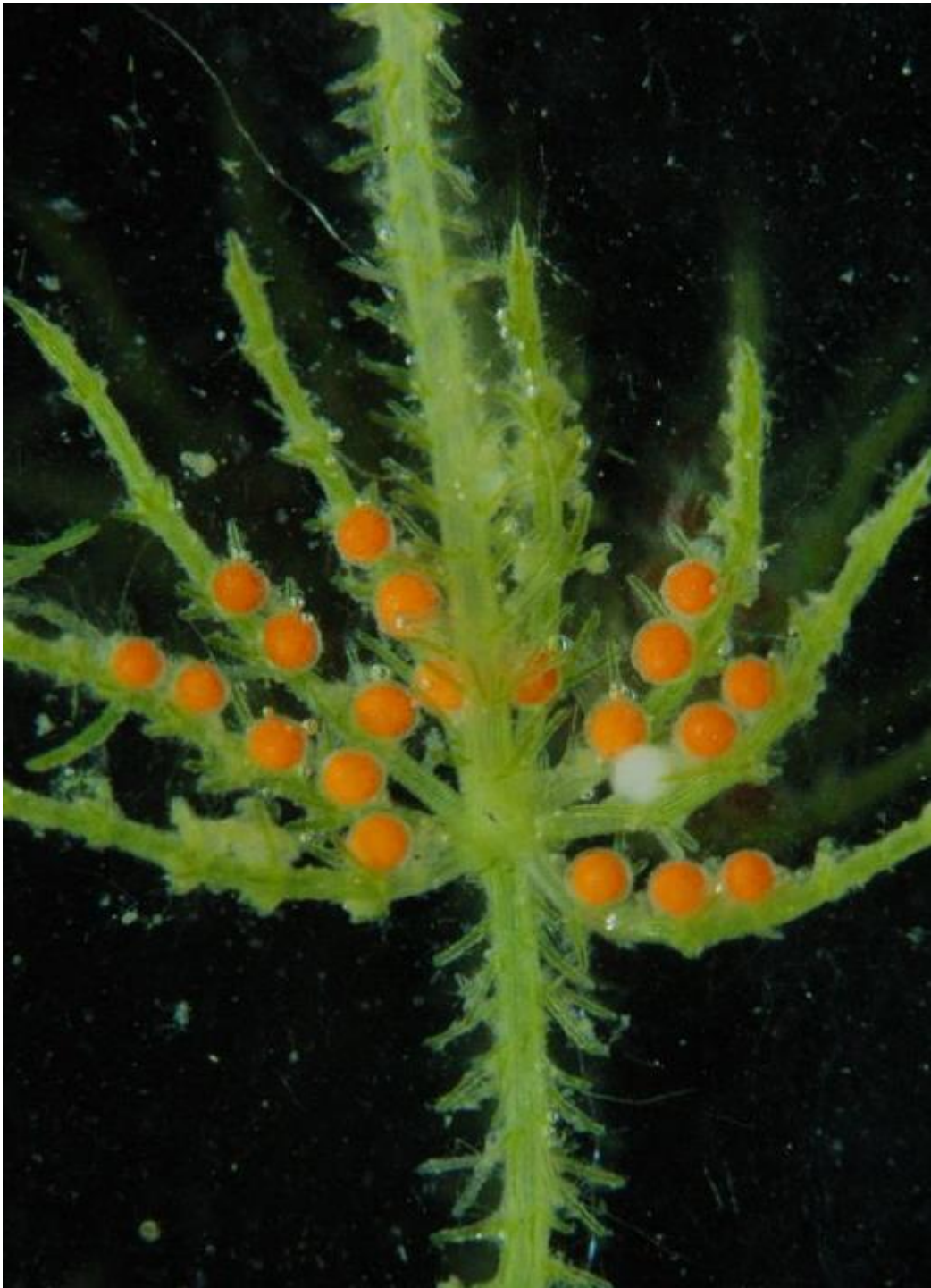
Chara aspera Willd., © 2010, D. Auderset Joye – Chara aspera Source : www.infoflora.ch